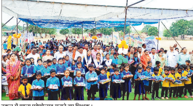
स्कूल में शाला प्रवेशोत्सव मनाते हुए शिक्षक।