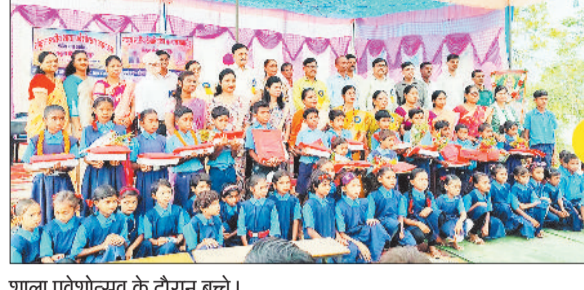
शाला प्रवेशोत्सव के दौरान बच्चे।