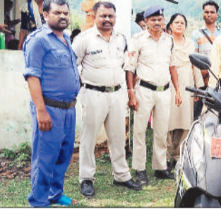
हरिभूमि न्यूज ▶▶ सोनहत