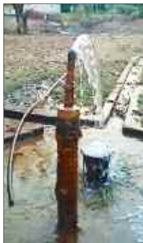
बोर से निकल रही जलधारा।