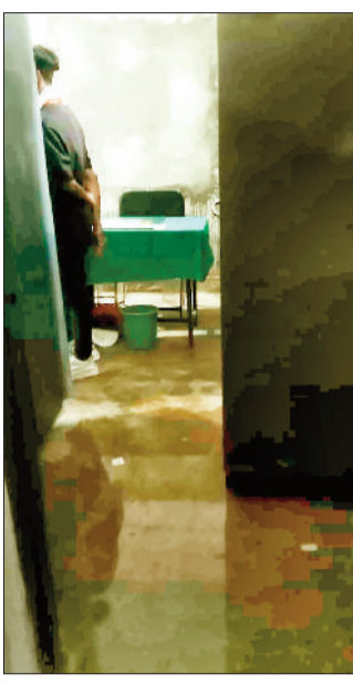
बीईओ कार्यालय के कमरे में भरा बारिश का पानी।