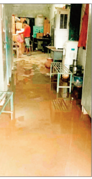
बीईओ कार्यालय के कमरे में भरा बारिश का पानी।

बतौली बीईओ जर्जर कार्यालय अब अधिकारी व कर्मचारियों के लिए परेशानी का सबब बन गया है। बीईओ कार्यालय भवन की हालत न सिर्फ दयनीय हो गई है बल्कि मरम्मत के अभाव में भवन काफी जर्जर हो गई है। ऐसे में थोड़ी सी बारिश हुई नहीं कि जगह जगह छत से पानी सीपेज होने लगता है। गत दिन भी लगभग एक घंटे तक हुई बारिश से पूरा कार्यालय तर बतर हो गया। सभी कमरों में पानी जमा होने से बैठने तक की जगह नहीं बची। ऐसा नहीं है कि भवन के जर्जर हो जाने के संबंध में उच्च अधिकारियों को अवगत नहीं कराया गया है बावजूद इसके किसी प्रकार की पहल नहीं होने से बीईओ कार्यालय में पदस्थ अधिकारी व कर्मचारी जर्जर भवन में कार्य काम करने को मजबूर है।