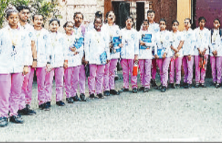
बैकुण्ठपुर। न्यू लाइफ हेल्थ एंड एजुकेशन सोसायटी द्वारा संचालित न्यू लाइफ इंस्टीट्यूट ऑफ नर्सिंग बैकुण्ठपुर के बीएससी नर्सिंग पंचम सेमेस्टर के छात्र-छात्राओं ने शिक्षकों के साथ क्लिनिकल प्रशिक्षण के लिए मनोचिकित्सालय इंस्टीट्यूट ऑफ न्यूरोसाइकियाट्री एंड अलाइड साइंसेज (रीन पास) रांची में प्रशिक्षण ले रहे हैं। एक दिवसीय 25 जून को उन्होंने

मरीजों का उपचार की सलाह एवं भर्ती प्रक्रिया के बारे में अध्ययन किया। साथ ही ईसीटी और ईडूजी कैसे लिया जाता है। छात्र-छात्राओं ने सिखा, इसके अंतर्गत अस्पताल में भर्ती मरीजों को उपचार की सलाह मिलने के बाद, मरीजों को ओपीडी बिल्डिंग के मुख्य द्वार के पास ग्राउंड फ्लोर पर स्थित कमरा नंबर 01 (एडमिशन कार्नर) में रिपोर्ट करना होता है। मरीजों को कमरा नंबर 1 में दी गई सलाह का पालन करना होता है और मरीजों का यहाँ मुफ्त में इलाज देते हैं। केन्द्रीय मनोचिकित्सा संस्थान (सीआईपी) में उन्होंने पाया कि वहाँ पर सारे वर्ग लिंग (बच्चों-वयस्क) तक का भारत का मानसिक स्वास्थ्य का प्रमुख संस्थान है जहाँ अस्पताल में भ्रमण कर