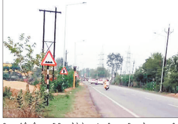
मिल गई है और अब निविदा होने के बाद इस पर ठेकेदार ने काम भी शुरू कर दिया है। एनएच 43 स्थित सूरजपुर जिले में कुर्वाड़ मोड़ से केशवनगर सिहें नदी पुल से पहले तक तथा ग्राम गिरवरगंज के

राष्ट्रीय राजमार्ग प्राधिकरण द्वारा रात्रि में अंधेरे की वजह से होने वाली सड़क दुर्घटनाओं पर प्रभावी नियंत्रण करने के उद्देश्य से जरूरी उपाय किए जा रहे हैं जिसके तहत आवश्यकता अनुसार अ नु सा र एनएच 43 चिन्हांकित किए गए ब्लैक स्पॉट जहां दुर्घटनाएं अधिक होने की सम्भावनाएं होती हैं, उक्त स्थलों में स्ट्रीट लाइट की स्थापना की जा रही है। बताया गया कि सरगुजा संभाग में ब्लैक स्पॉट के रूप में चिन्हित स्थलों में उचित प्रकार की व्यवस्था के लिए दो करोड़ तीस लाख की राष्ट्रीय राजमार्ग प्राधिकरण से स्वीकृति